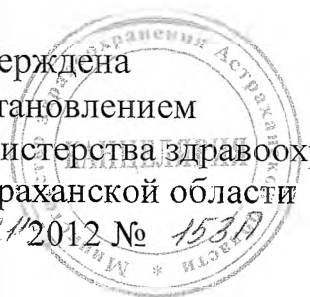
Схема ежемесячного отчета о деятельности учреждений здравоохранения по оказанию медицинской помощи беспризорным и безнадзорным несовершеннолетним

Утверждена постановлением министерства здравоохранения Астраханской области от 04/11/2012 № 1530